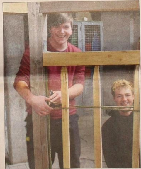
Bevor der Lehm an die Wand kommt, müssen zuerst die Weidenzweige eingeflechten werden.

Dabei geht es um den Schnellenmarkt in Uelzen. Die Schüler aus dem Bereich Tischlerei untersuchen beispielsweise mithilfe von Wärmebildfotos, wo sogenannte Wärmelücken an