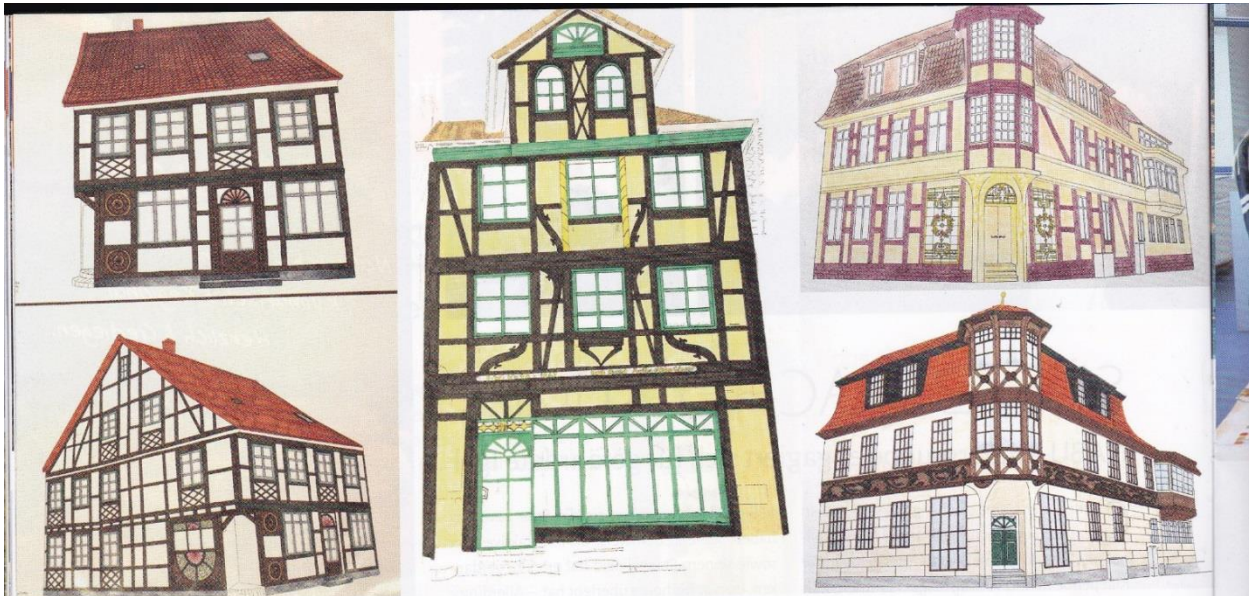
Entwurfszeichnungen von Schülern der Berufsfachschule Gestaltung.