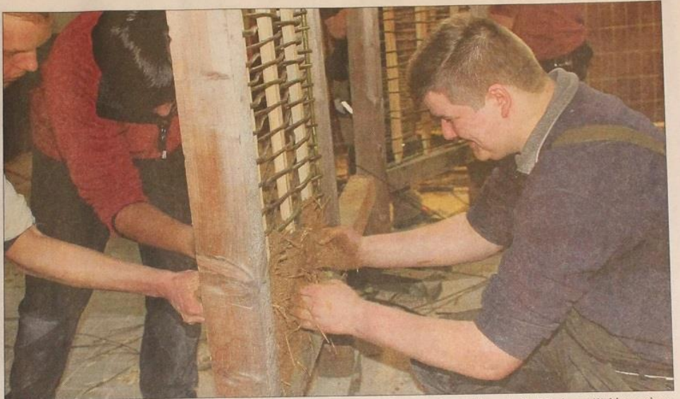
Die Schüler der BBS I packen gut mit an: Mit der Mischung aus feuchtem Lehm und Stroh verstärken sie die Wände aus Weidenzweigen. Diese haben sie zuvor in den Holzrahmen eingeflechten.

Den Schülern gefällt's: „Es ist interessant zu sehen, dass man aus natürlichen Werkstoffen eine massive Wand herstellen kann“, findet etwa Kurt Dehr-